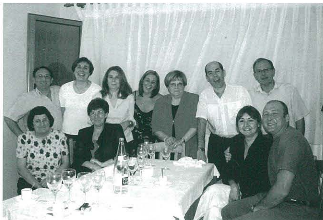
Cloenda del curset de català

El jurat podrà declarar desert algun premi o dividir-lo si ho creu oportú i no es podrà atorgar més d'un premi a un mateix pintor.