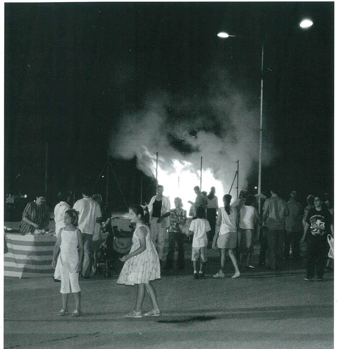
Molta participació en la foguerada de Sant Joan