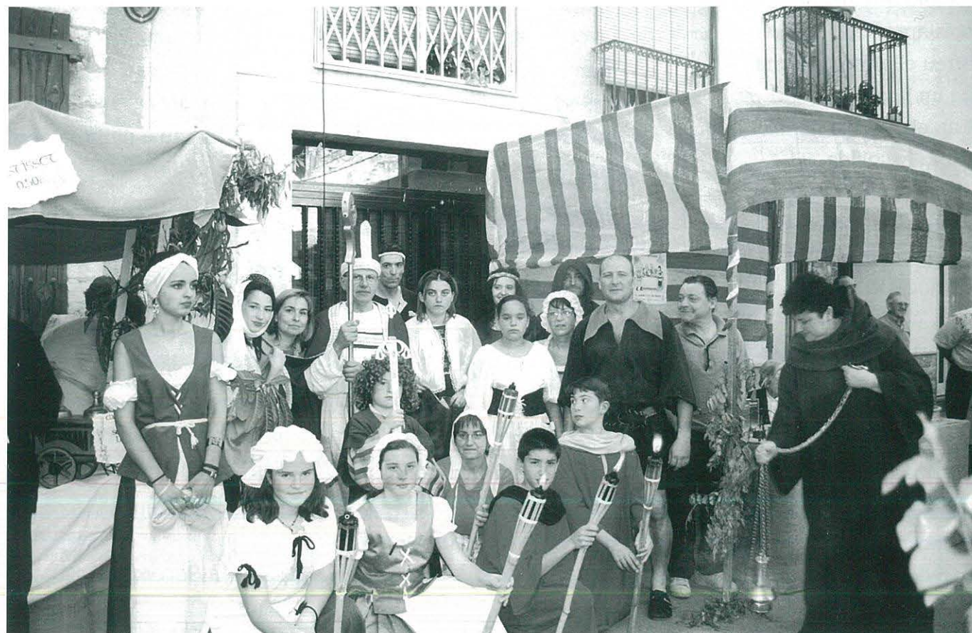
Grup de participants al Mercat Medieval